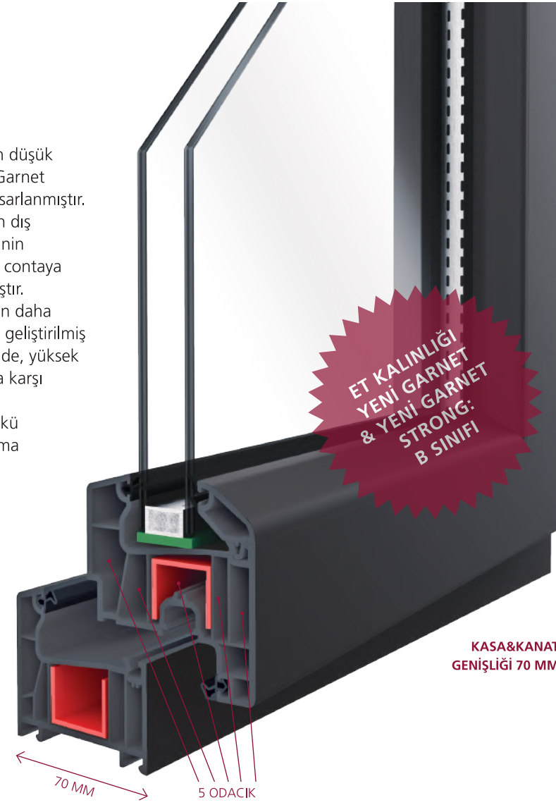
KASA&KANAT GENİŞLİĞİ 70 MM

Pencere sistemlerinin en önemli kalite kriterlerinden biri de ses yalıtımıdır. Havalimanı, tren yolu ya da büyük otobanlara yakın yapılarda oluşan 70 dB civarındaki yüksek ses seviyesi Yeni Garnet ve Yeni Garnet Strong sistemleri ile bir çocuğun rahatlıkla uyuyabileceği ses seviyesi olan 30 dB'nin altı değerlere düşmektedir. Yeni Garnet ve Yeni Garnet Strong serileri ile 40 dB değerine kadar ses yalıtımı sağlanabilmektedir. Böylelikle en gürültülü ortamlarda bile kaliteli yaşam seviyesinde ses ortamı oluşturmak mümkündür.